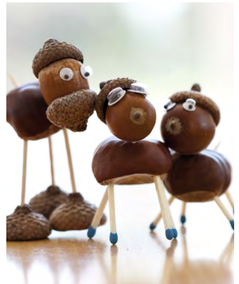
Fotos: oben © Ramona Heim/AdobeStock; mitte rechts © Carola Schubbel/AdobeStock; unten rechts © Biewer_Jürgen/AdobeStock

Deiner Kreativität sind keine Grenzen gesetzt. Viel Spaß!